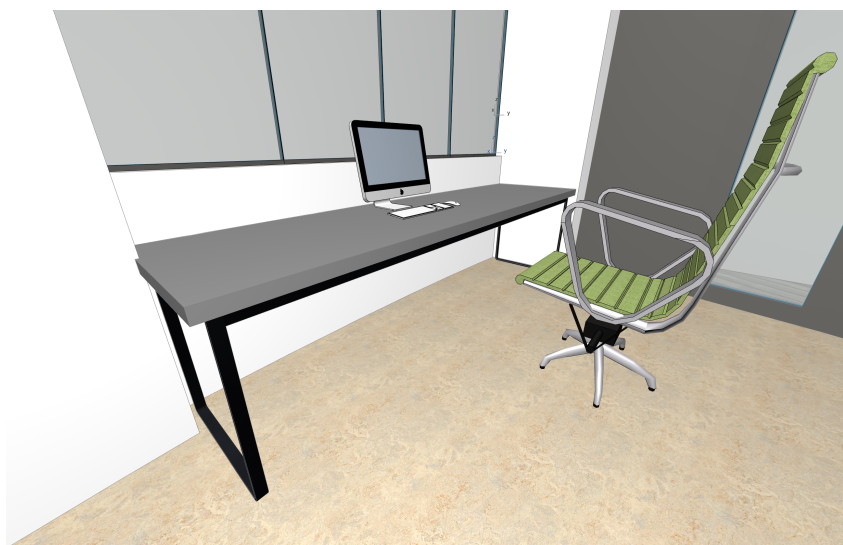
vizualizace pracovního stolu