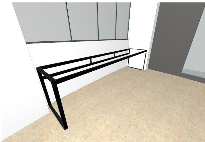
vizualizace nosné konstrukce pracovního stolu

Před zahájením výroby, objednáním, nebo zabudováním PSV. budou na stavbě ověřeny stavební rozměry, způsob zabudování a stavební návaznosti a barevné řešení. Součástí dodávky výrobků bude i dílenská dokumentace výrobků PSV. Dílenská dokumentace bude předložena k odsouhlasení investorem a architektem stavby. Veškeré výrobky, pohledové materiály, spoje, styky atd. budou na stavbě vyzorkovány a odsouhlaseny autorem návrhu. Nedílnou součástí projektové dokumentace je D.1.1a - Technická zpráva a D.1.3 - Požární bezpečnostní řešení i jiné související části projektové dokumentace.